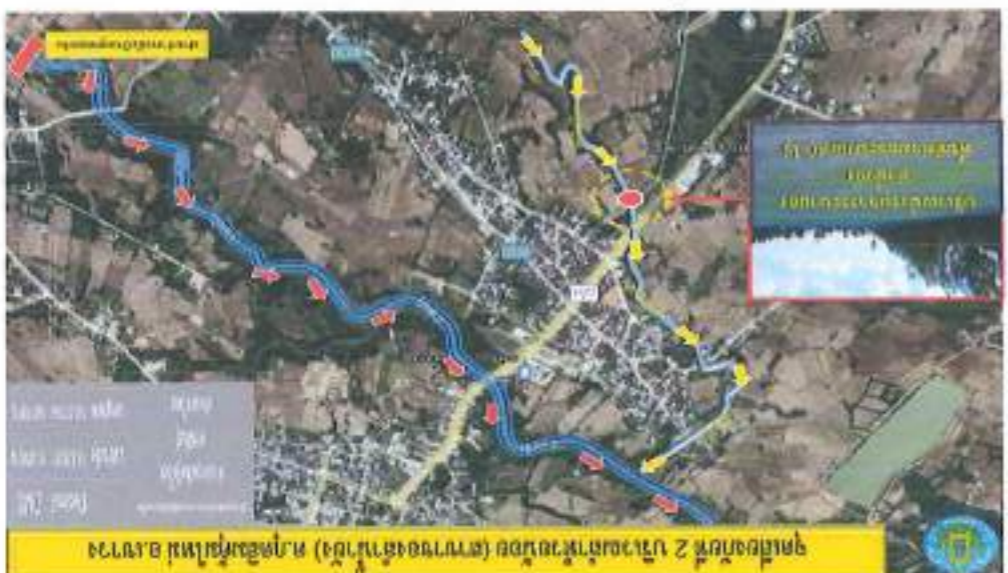
ផែនទី ៦ តំបន់កសិកម្ម និង តំបន់ស្រែចម្រុះ ០០០+៥៩៧៧ ភូមិស្រែចម្រុះ -