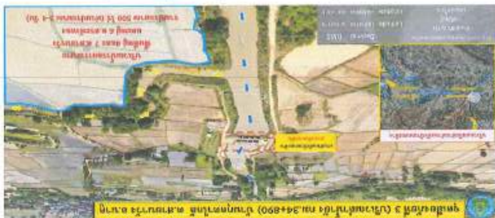
ផែនទី ៦ តំបន់កសិកម្ម និង តំបន់ស្រែចម្រុះ ០០០+៥៩៧៧ ភូមិស្រែចម្រុះ -